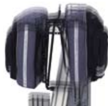
Vibrationsprüfung Vibration test