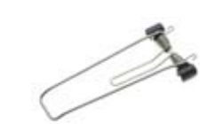
Art. 70123 Klick Federklappe Edelstahl für Logo / Vega 2012 Spring clamp stainless steel for Logo Evo / Vega 2012 Gewicht / weight: 117 g