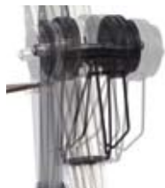
Schwingungsprüfung Oscillation test

Sie haben schon von DIN und ISO gehört? Diese beiden härtesten Prüfnormen der Industrie bestimmen, was die meisten Gepäckträger können müssen. Unsere Gepäckträger lachen darüber.