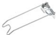
Art. 70017 Federklappe Edelstahl für Locc Spring clamp stainless steel for Locc Gewicht / weight: 107 g