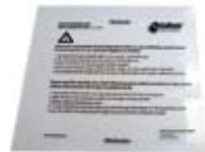
Art. 79005 Schutzfolien-Set Protection foil-set Gewicht / weight: 4 g