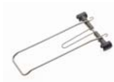
Art. 70114 Klick Federklappe Edelstahl für Cargo Evo 2012 Spring clamp stainless steel for Cargo Evo 2012 Gewicht / weight: 108 g